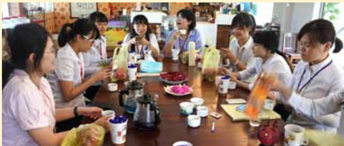
學生在農場摘的「火龍果」、「蝶豆花」，可製成「火龍果冰淇淋」、「蝶豆花茶」（如圖示桌面），極具營養價值。