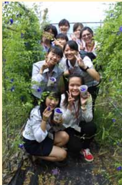
學生手中拿的是「蝶豆花」。