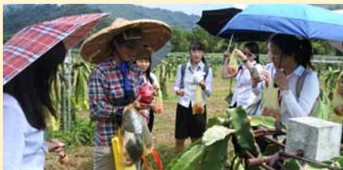
學生手中拿的是「火龍果」。